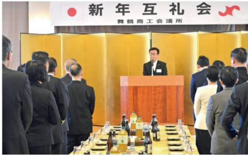
年頭所感を述べる総経理仁史会頭（1月6日：舞鶴市内ホテル）

令和8年の新年互礼会を1月6日に舞鶴市内のホテルで開催しました。当日は、会員事業所と行政機関など市内外の各所から約260人が出席し、賓詞を交歓して交流を深めました。 総経理会頭は年頭所感で、国が成長戦略会議を創設し