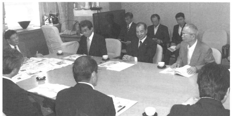
京都府副知事に要望