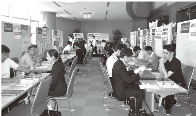
今年も舞鶴市商工観光センターの4・5階で開催（8月9日）

なお、今回、会場の受け付け業務などで、舞鶴支援学校の生徒や「障害者就業・生活支援センター『わかば』」の皆さんが参加。スムーズな会場運営に活躍いただきました。