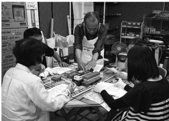
店主(中央)から「包丁の研ぎ方」を学ぶ

商業振興の一環として、舞鶴商工会議所商業部会が行う「第3回舞鶴まちゼミ」は5月18日から6月17日まで開催しました。今回は、全23講座で