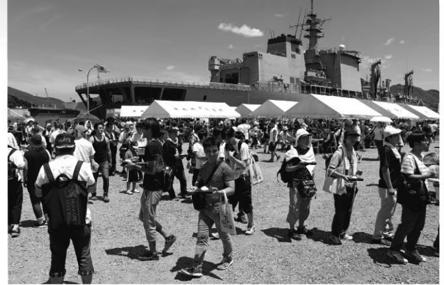
「まいづる海自カレー」の食べ比べでにぎわう（7月21日北吸栈橋）

一方、舞鶴商工会議所の「まいづる海自カレー」については、格安の食券で参加11店舗中、3店舗のカレーが味わえる“食べ比べカレー”として実施。炎天