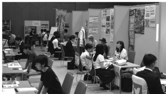
ふるさとコールMAIZURU (8月11日商工観光センター)