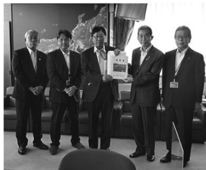
舞鶴若狭自動車道全線4車線化を (8月2日:国土交通省近畿地方整備局)