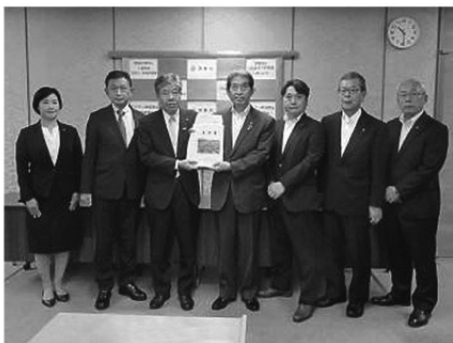
京都舞鶴港の機能強化と エネルギー基地としての機能拡充を (7月19日:京都府庁)